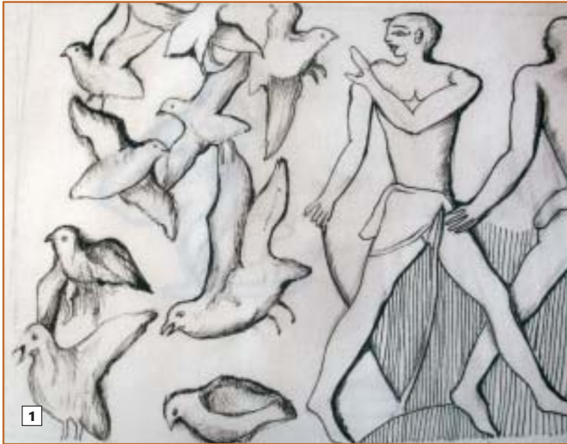
1. קטע מתוך תבליט מהשושלת החמישית בסקרה, שבו נראים שלווים שהופרעו במהלך הקציר. 2. ציוד שלווים ברשת, קטע מתוך תבליט מהשושלת השישית, במססבה באל-עריש העתיקה.