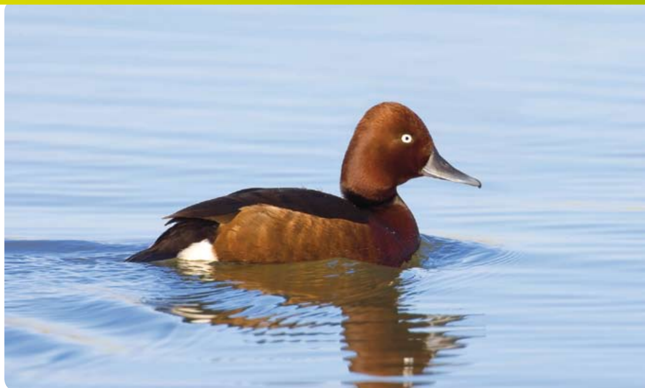
צולל הביצות.

צולל הביצות הוא ברווז חששן ושקט למדי, מהקטנים שבברווזים הצוללים. גופו קצר (כ־40 ס"מ), מצחו גבוה ויש לו עין לבנה בולטת ומשולש לבן בקצה גופו. החלק התחתון של בטנו לבן ונחשב לסימן הזיהוי החשוב ביותר בשטח