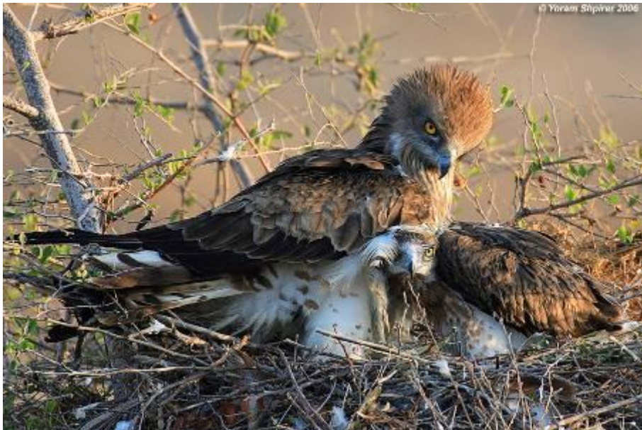
צילם יורם שפירר

תמונות נוספות באתר הבית של יורם שפירר http://www.pbase.com/shpirery